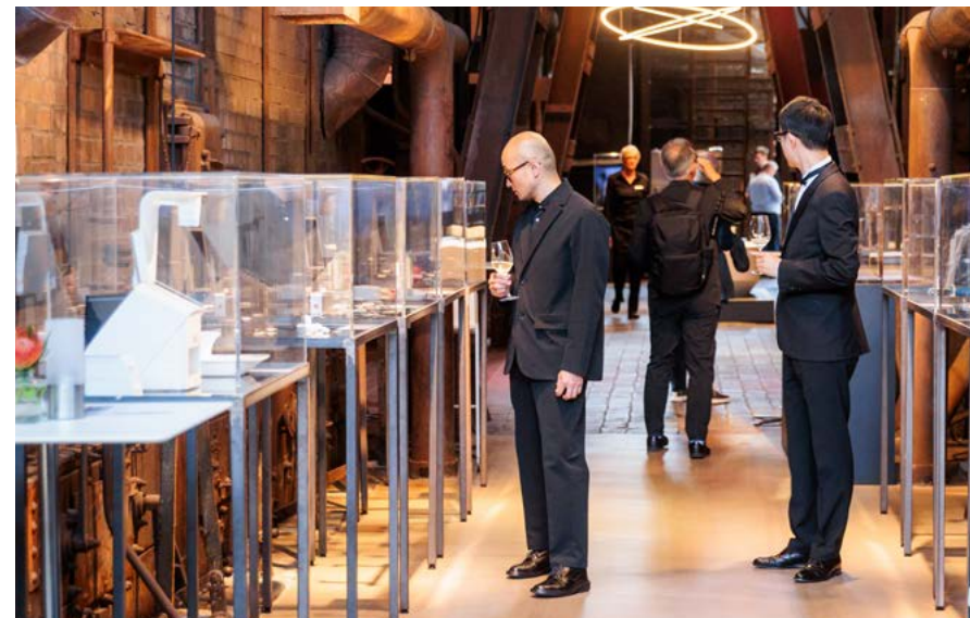
Das Red Dot Design Museum Essen zeigt Produkte, die im Red Dot Design Award ausgezeichnet wurden