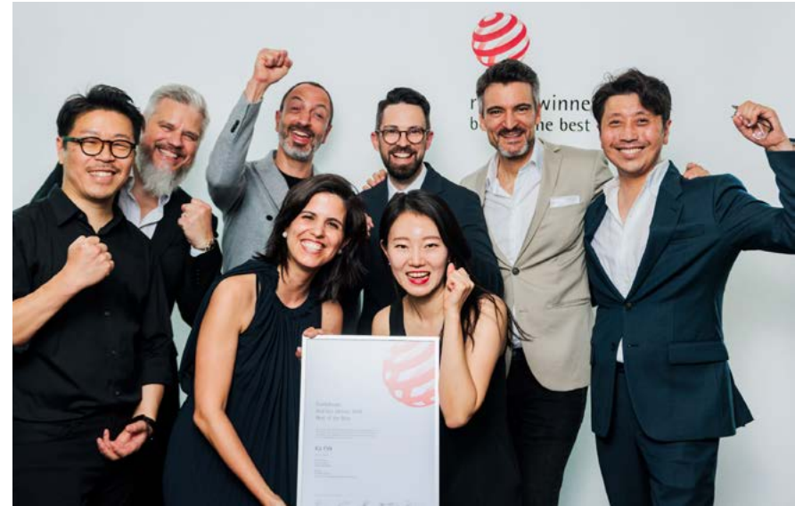
Die feierliche Siegerehrung in Essen bildet das große Finale des Wettbewerbsjahres

Um alle Benefits als Sieger des Red Dot Award: Product Design uneingeschränkt nutzen zu können, müssen Sie Ihr Winner Package buchen. Mit der Teilnahme am Red Dot Design Award haben Sie sich bereits im Voraus mit dieser obligatorischen Buchung einverstanden erklärt, die im Falle einer Auszeichnung auf Sie zukommt. Sämtliche Buchungsoptionen und die damit verbundenen Leistungen finden Sie auf den folgenden Seiten.