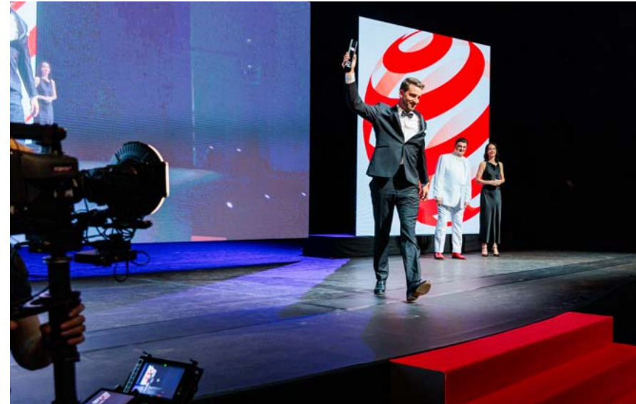
Die Bühnenauftritte werden live auf die LED-Wände gestreamt und den Gästen im Nachgang als Mitschnitt zur Verfügung gestellt

Die Siegerehrung wird von Kameras aufgezeichnet. Das Kamerabild wird zudem live auf LED-Wände im Saal projiziert. Ein Videomitschnitt des eigenen Bühnenauftritts wird unbearbeitet und in Full-HD zur Verfügung gestellt. Das Video ist zur freien Nutzung bestimmt. Die Bereitstellung des Videomitschnitts dauert etwa zwei Werktage.