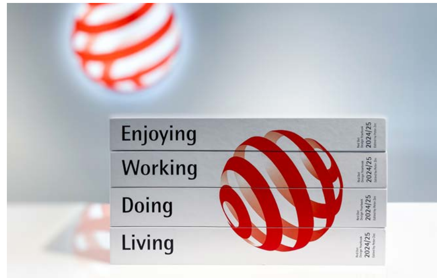
Die Jahrbücher des Red Dot Design Awards bilden eine Chronik ausgezeichneter Gestaltungen