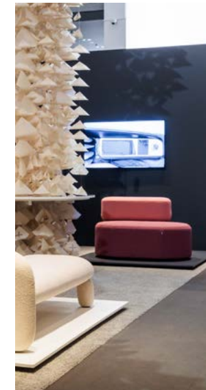
Präsentation als Film