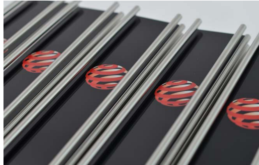
Die Red Dot Trophy wird den Siegern der Auszeichnung „Red Dot: Best of the Best“ verliehen

Die Urkunde ist ein offizielles Zertifikat der Auszeichnung und wird ausschließlich in gedruckter Form ausgegeben. Sieger erhalten sie persönlich im Juli während der Preisverleihung oder später per Post. Anzahl und Größe der Urkunden hängen von der Auszeichnung und dem gebuchten Paket ab. Zusätzliche Zertifikate können Sie jederzeit über das My Red Dot-Portal ordern. Dort besteht auch die Möglichkeit, die Credits auf den Zertifikaten zu ändern.