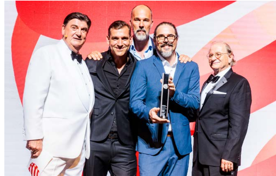
Im Essener Aalto-Theater nehmen die Sieger des Red Dot: Best of the Best ihre Trophäen entgegen

Nach Abschluss Ihrer Paket-Buchung können Sie das international bekannte Red Dot Label sofort nutzen und Ihren Erfolg kommunizieren. Die Buchung gilt als abgeschlossen, sobald Sie die Zahlungsbestätigung per E-Mail erhalten haben.