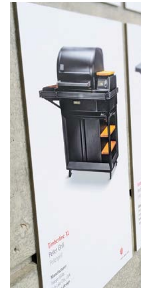
Präsentation als Poster