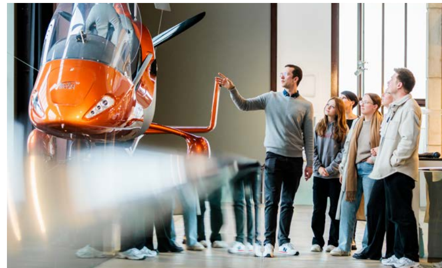
Führungen durch das Red Dot Design Museum Essen bieten die Möglichkeit, Hintergrundwissen zu Industriedesign aus der ganzen Welt zu erlangen

Die Führung ist mit einer Dauer von einer Stunde angesetzt.